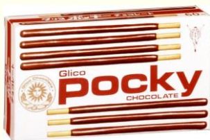
1966年発売当初の「ポッキー」

食べる時の「ポッキン」という音にちなみ、「ポッキー」という名前がつけられました。