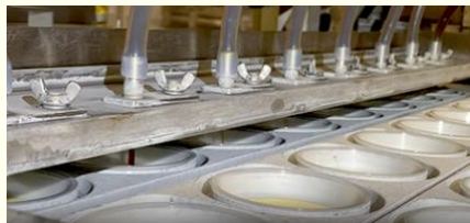
次にカラメルソースを流しこむ

「プッチンプリン」クイズは以上です。「プッチンプリン」はこれからも「プッチン」することで味わえる、より一層（いっそう）こだわったおいしさや楽しさで、人々の生活に常（つね）によりそいながら進化を続けていきます。