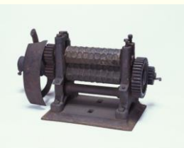
自社開発第1号のハート型ローラー成型機 1921年

創業（そうぎょう）以来「ハート型（がた）」にかける思いは受け継（つ）がれ、現在（げんざい）も栄養菓子（えいようがし）「グリコ」のシンボルのひとつとなっています。