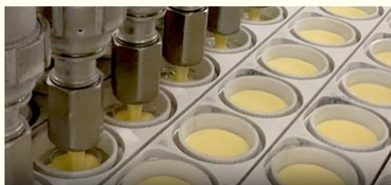
プリンの液（えき）を流しこむ

カラメルソースはプリンの液（えき）より重いので、後から流しこんでもカップの下に沈（しず）んでいきます。