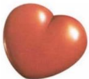
ハート型のグリコ