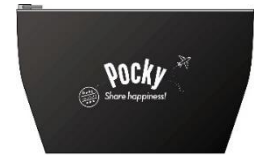
ポキ旅オリジナルポーチ（イメージ）