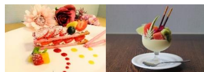
オリジナルポッキースイーツ (イメージ)

※ホテルモンテ福岡のみ 2～3 名様用のケーキを 1 室につき 1 つご用意します。