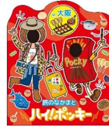
ポキ旅オリジナル顔出しパネル（イメージ）

体験スポット： 「ポキ旅オリジナル宿泊プラン」実施の 21 の宿泊施設に「ポキ旅オリジナル顔出しパネル」を設置。 「ハイ！ポッキー」の掛け声で仲間とご当地にちなんだ記念撮影を楽しめます。