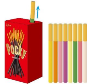
「ポキ旅くじ」（イメージ）

店舗キャンペーン期間中、JTB の対象 30 店舗にて期間限定で「ポキ旅くじ」を設置します。希望するお客様にはポッキーのパッケージをイメージしたくじ引き箱より、宿泊施設名が書かれた色とりどりのポッキーくじを引いていただきます。「ポキ旅くじ」を引いて、ポキ旅オリジナル宿泊プランにてご予約いただいたお客様にお1人につき1つ、「ポキ旅オリジナルポーチ」をプレゼントします。旅行の行き先がなかなか決まらない方などにおすすめです。