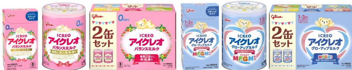
画像：乳児用粉ミルク「アイクレオ バランスミルク」シリーズ、幼児用粉ミルク「アイクレオ グローアップミルク」シリーズの主なリニューアル商品

江崎グリコ株式会社は、母乳を目指し品質にこだわった乳幼児用ミルク「アイクレオ」ブランドの粉ミルク7品について、より溶けやすくダマになりにくい品質にリニューアルし、2024年6月24日（月）より、全国で順次販売開始します。「アイクレオ バランスミルク」は、今年春に本格稼働を開始した岐阜工場の最新設備での製造により、溶けるまでの平均攪拌時間が従来品と比べ半減しました。